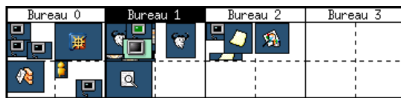
FIG. 1: Un pager qui represente quatre grands bureaux virtuels (2x2).

La plupart des gestionnaires de fenêtres X Window possèdent un espace de travail virtuel. Le modèle le plus commun est une suite de bureaux virtuels indépendants entre eux de la taille de l'écran. Certains gestionnaires de fenêtres proposent de grands bureaux virtuels : une matrice n \times m consitutée de pages de la taille de l'écran. La navigation dans l'espace de travail virtuel peut revêtir différentes formes. L'un des outils utilisés est un gestionnaire d'espace virtuel ou pour être plus concis un pager . Cet outil reproduit une vue miniature de tout l'espace de travail comme dans la Figure 1.